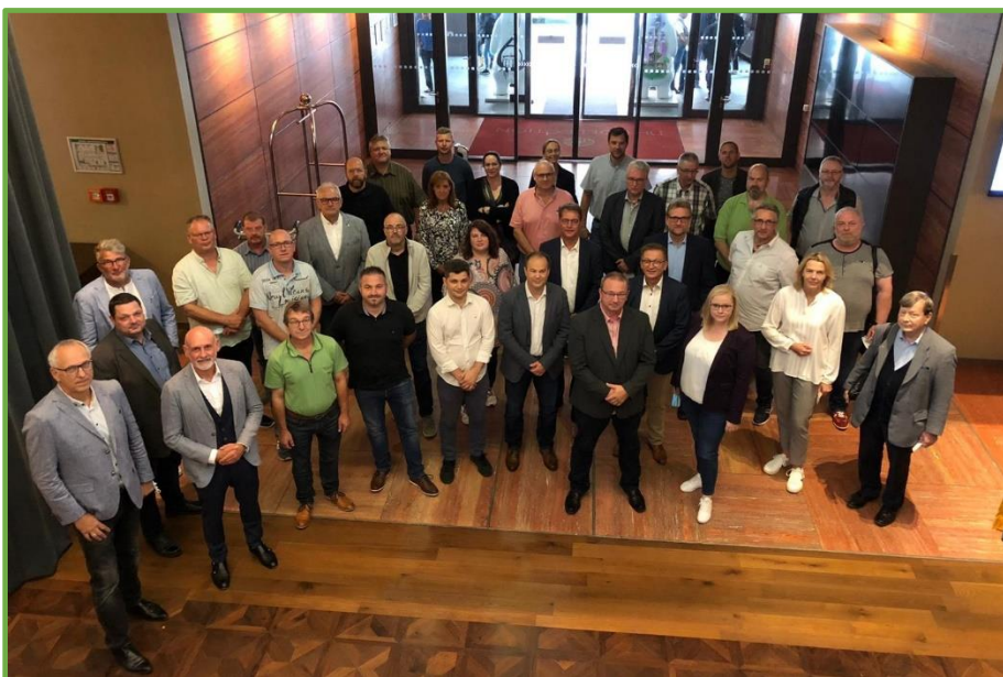
Die Vertreter der dbb Mitgliedsgewerkschaften im Gesamtbetriebsrat.